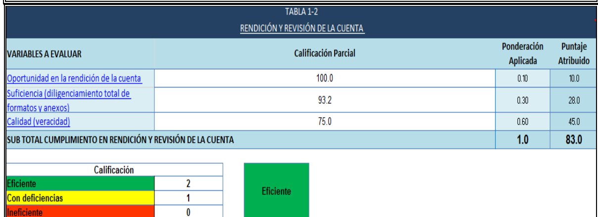
TABLA 1-2 RENDICIÓN Y REVISIÓN DE LA CUENTA

Fuente: Rendición de Cuentas Gestión Transparente, Personería Municipal de Itagüí Elaboró: Zuli Andrea Quiceno Vélez, Profesional Universitaria